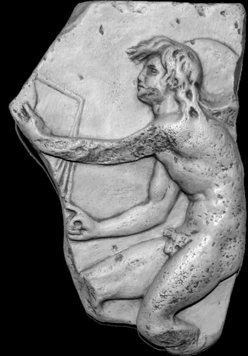
Kairos, dios griego del momento fértil