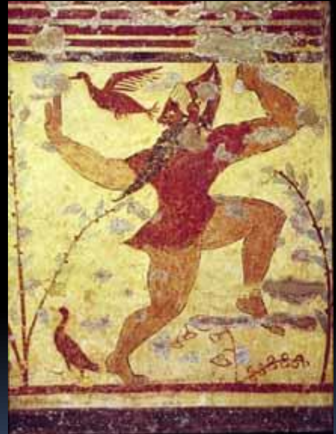
El dios etrusco Phersu, de donde proviene el término “persona”

→ Incluso la “terapia individual” está insertada en la sociedad.