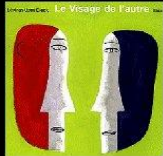
La cara del Otro (The face of the Other)