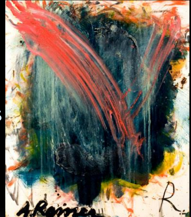
Arnulf Rainer, Fingerschmiere